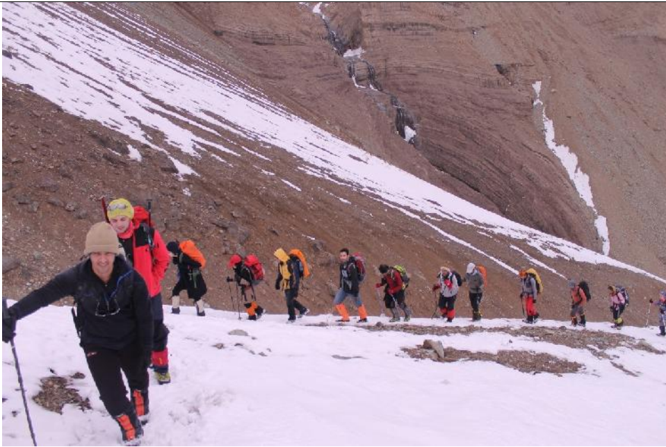
مسیر صعود به قله ساکا و آتشکوه