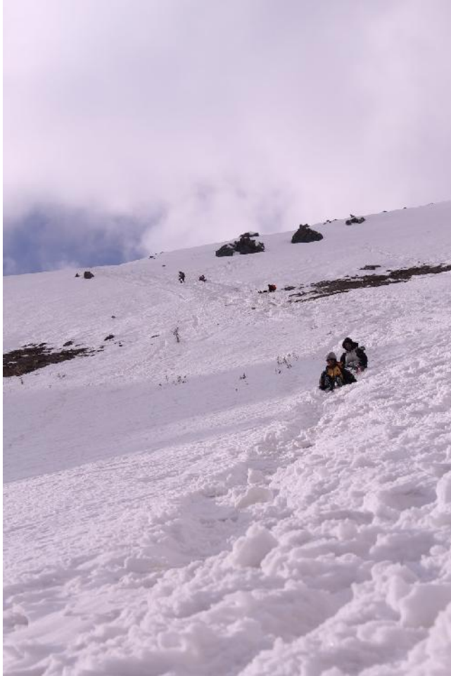
سرسره بازی در مسیر برگشت

کوهنوردی فارغ التحصیلان دانشگاه صنعتی امیر کبیر (پلی تکنیک تهران)