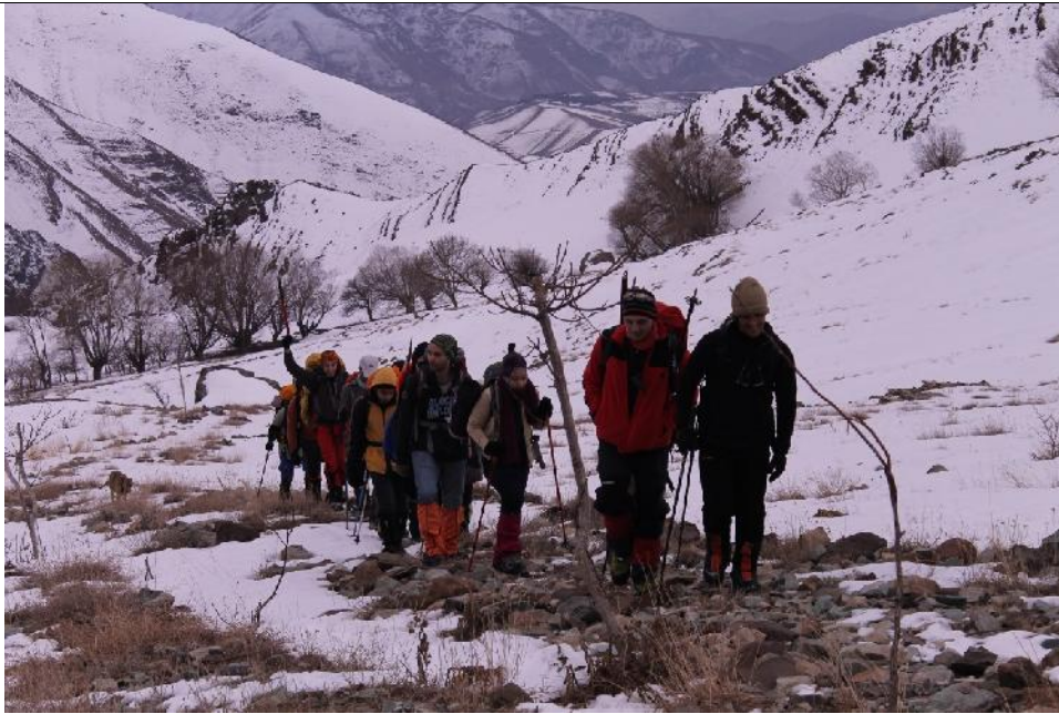
مسیر منتهی به کلبه و جانپناه در پای صعود