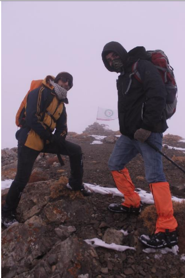
دو راهی ساکا- آتشکوه (مه غلیظ و باد شدید)