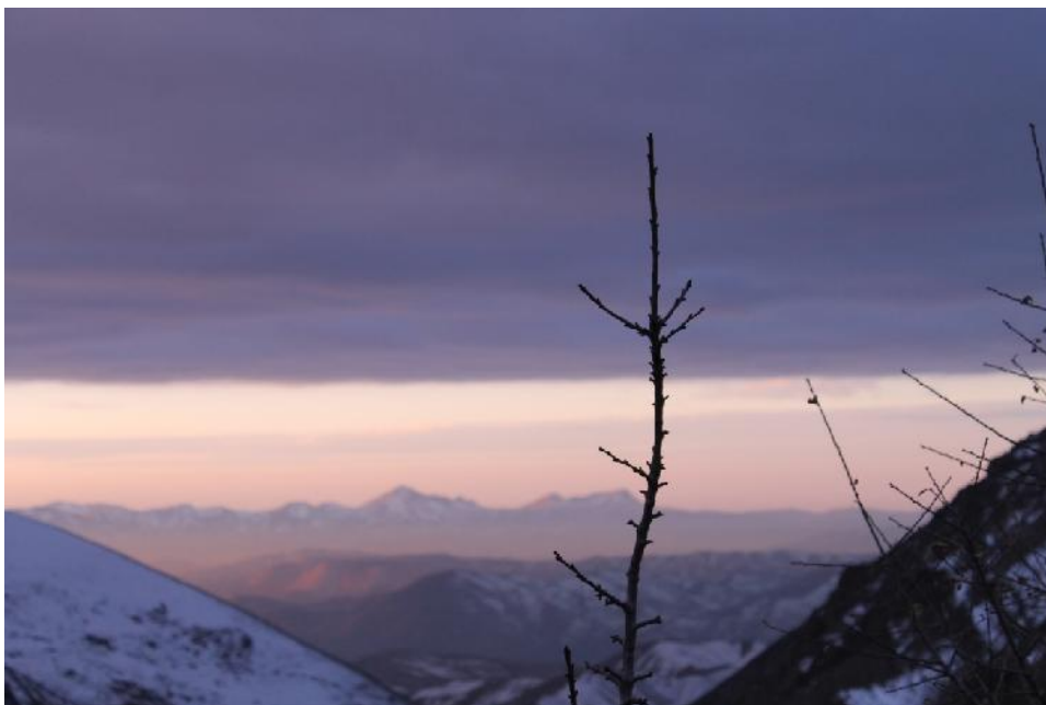
افق پهناور و زیبای کوهستان‌های منطقه