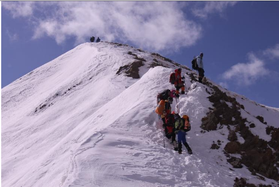
مسیر منتهی به قله ساکا

کوهنوردی فارغ التحصیلان دانشگاه صنعتی امیر کبیر(پلی تکنیک تهران)