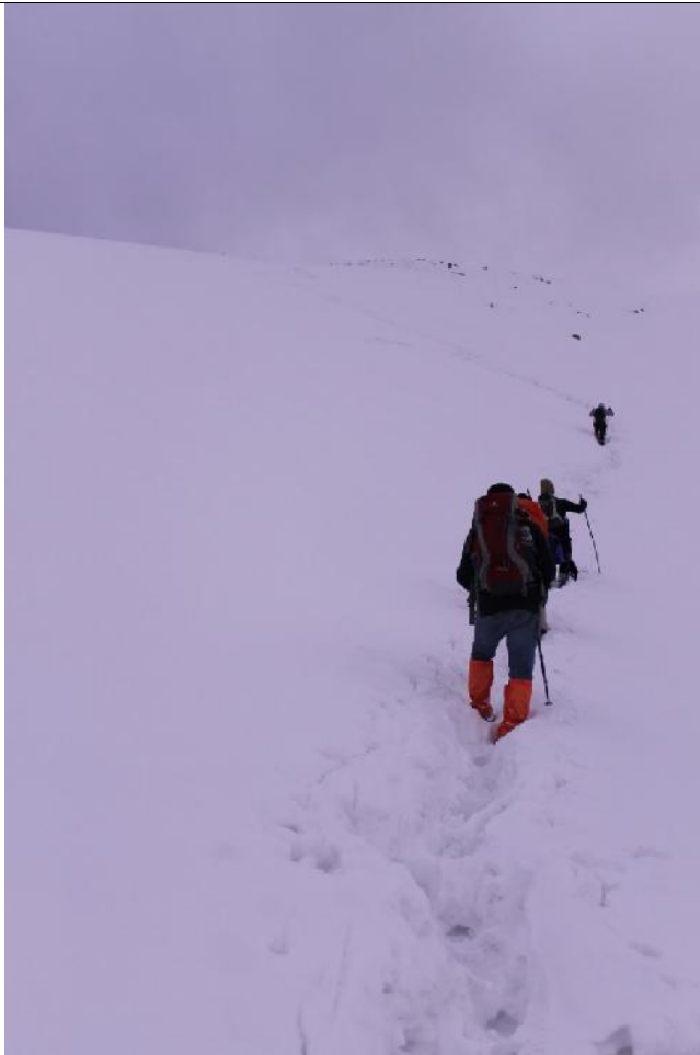
عمق برف در منطقه بهمن خیز

کوهنوردی فارغ التحصیلان دانشگاه صنعتی امیر کبیر(پلی تکنیک تهران)