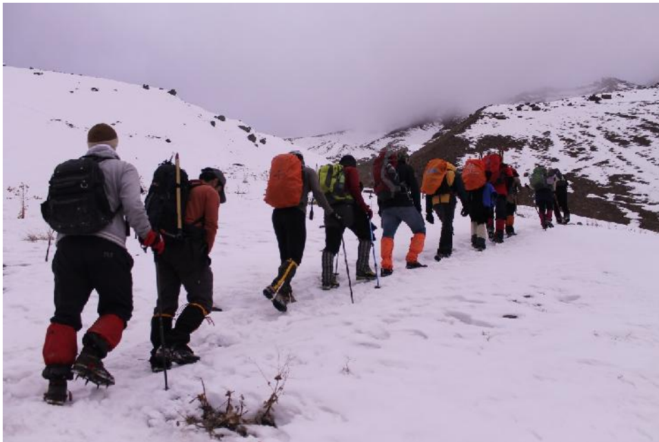
مسیر صعود به سمت دو راهی ساکا- آتشکوه